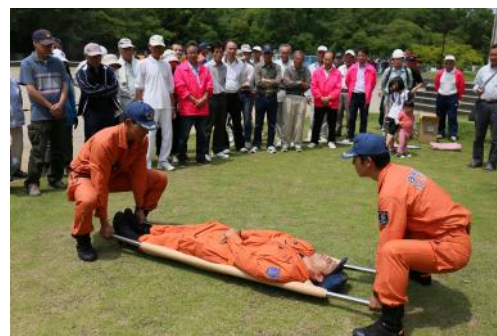
▲昨年の講習の様子。

災害が発生し避難所を開設することになったという想定で、スムーズに運営するために必要と考えられる「総務班」「避難者支援班」「情報班」「救護班」「衛生班」「暮らし支援班」を、地区別で担当しました。それぞれの班で課題抽出を行いました。どの班もとても熱心に話し合われ、時間が足りないという声も聞かれました。 このワークショップは、訓練当日まであと2回程度開催する予定です。これまでに参加していた方が少ない状況です。多く、女性が少ない状況です。