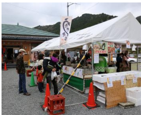
横輪桜の花吹雪舞い散る中、開催された桜まつり。ガイドツアーも、ステージも屋台もみんなで来場者をおもてなし。

沼木ブランド委員会では、横輪桜の染め物に取り組んでいます。沼木まつりでも体験して頂きましたが、先日の横輪桜まつりにて、染めた作品を展示し、希望される方には、販売もさせて頂いていただきました。