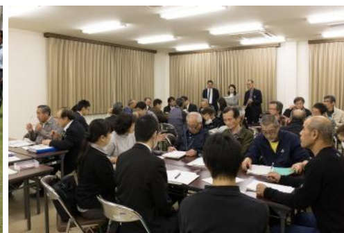
▲真剣な面持ちでワークショップに参加する各地区の防災リーダーたち

備えれば憂いなし。有事に備えて、子育て中の方、介護している方、避難所生活に不安のある方などには特に、この機会にご参加いただく必要があるのではないかとこの意見がでました。 5月17日開催される防災訓練への積極的なご参加を、お待ちしております。