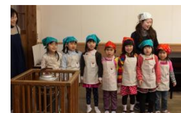
小さなウエイター・ウエイトレスさんたちは大忙しです!

もたちがウエイター・ウエイトレスになり、張り切ってお客様をおもてなししてくれます。メニューは子どもたちと同じ給食。新聞で紹介されてからは、市内各地からのお問合せも多いのだとか。参加費は、三五〇円、先着10名となりますので、興味のある方は保育園までお問い合わせください。