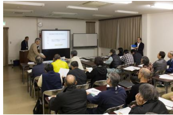
4月1日に開催された防災リーダー会議の様子。この日は総勢50名近い方が集まりました。本番に向けて着々と準備が進みます。

5月17日本番の防災訓練にご参加ください! 沼木まちづくり協議会では、地区住民の防災意識を高めるため、避難経路の確認、地域の危険箇所を見直すワークショップやスモーク体験など、これまで2回の防災訓練を実施してきました。 第3回沼木防災訓練として、5月17日(日)に『避難所運営訓練』を開催します。4月1日