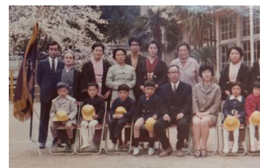
▲みどり保育園で発見! 矢持小学校最後の卒業生が入学した時の写真!沼木の有名人が写っていますね。誰だかわかりますか?このほか、歴代の卒業生の写真も閲覧できますので、訪問の折には声を掛けてくださいね。

みどり保育園では、月に一度、みどり保育園の子どもたちとふれあい、保育園のある矢持町まで足を運んでいただくきっかけにできればと、伊勢市内の住民に呼びかけ、「給食ランチ&カフェ」を開催しています。当日は、年長組の子ど