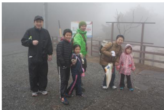
深い霧の中、励ましあって頂上に到達。豚汁とぜんざいが振る舞われました。その後、ビンゴゲームのお楽しみも!下山するころには霧も晴れ、みんなの表情も晴れ晴れとしていました。

山頂で参加者を待ち受けていたものは、朝早くから炊き込みの準備をしていた自慢の豚汁とぜんざい。霧雨の中、時間と共に冷え切る身体に、一杯の温もりは何物にも代え難く、有難いの一ことに尽き、感謝の気持ちでいっぱいになりました。「沼木の住民で良かった。沼木に関わる方々と触れ合えて良かった。」と、誰もが思った瞬間だった。