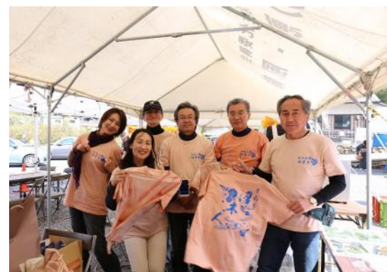
4月11,12日でまつりのブースに出店したブランド委員会の皆さん。とても盛り上がっていました。

結果、横輪町の方々は警備から解放され、おもてなしの向上に力を注ぎ、新たに始まった横輪桜ガイドツアーに参加されたお客様も満足されていました。