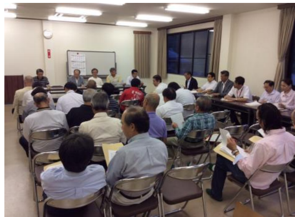
お忙しい中お集まり頂きありがとうございました。

沼木コミュニティーセンターにて、昨年度の事業報告と会計報告、そして新年度の役員選出と事業計画が発表されました!