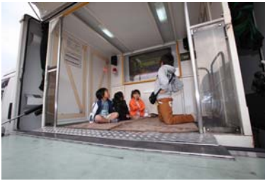
地震体験車=子供たちも