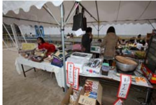
地域の皆さんも自慢の品を販売しました！