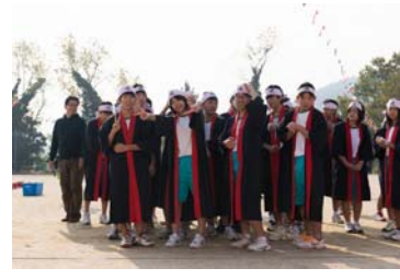
沼中ソーラン集合