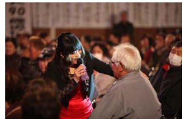
りえちゃんも会場で交流