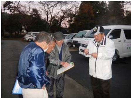
安全運行のための点呼の様子