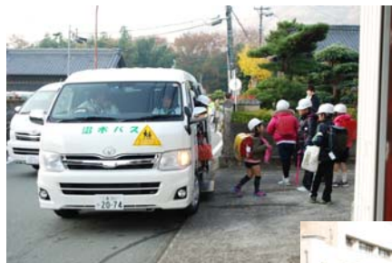
矢持町・横輪町の 子供たちも沼木 バスで通学