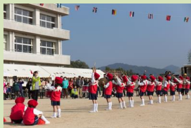
みどり保育園のマーチング