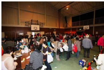
今年もバザーは大盛況！