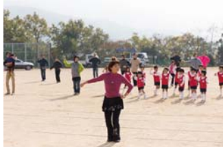
健康体操もみんな一緒