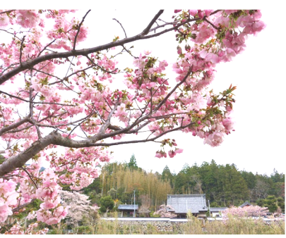
横輪桜の写真です。

【運行料金】 小学生以上一人一回一〇〇円(寿バス乗車券が使えます) 【寿バス乗車券について】 沼木バスでも寿バス乗車券が使えます。寿バス乗車券は一〇〇円乗車券、1回乗りきり乗車券、五〇円乗車券(対象者限定)の三種類があり、交付時にいずれかを選びます。一〇〇円乗車券、五〇円乗車券をお持ちの方は一〇〇円分でご利用ください。