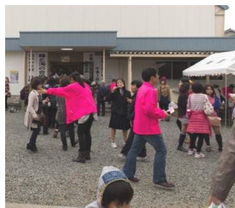
昨年は約1000名の方にご来場頂きました。