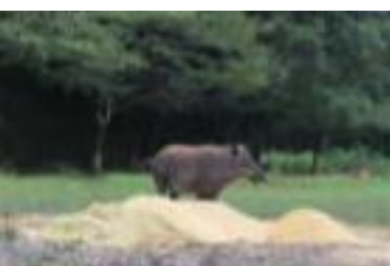
これは！！沼木近隣に出没中のイノシシ君餌を求めて里に出てきた様子。うりぼうは可愛いけれど、親はなかなかの迫力です。ペンネーム 矢持仙人 さん