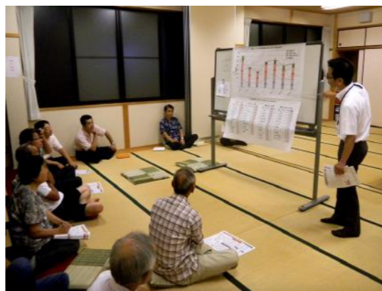
上野町で開催された意見聴取会の様子。沼木地区の全7カ所にて論議が行われました。