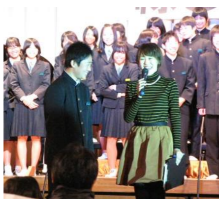
沼木中学校の生徒による合唱