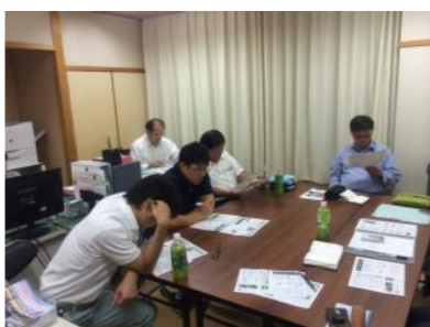
各委員会、よりよい沼木を作るためにみんなで何ができるかを考えながら、会議を開いています。写真は広報委員会の編集会議の様子。

現在イベント委員会では、皆さんに喜んでいただける「沼木まつり」となるよう準備を進めております。詳細は改めて、チラシにてお知らせします。イベントへの参加はもちろん、ボランティアとして運営に参加して下さる方も大募集しておりますので、こちらどうぞよろしく願います。