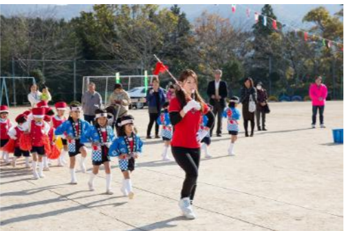
みどり保育園の園児による鼓笛隊が元気に登場！子供たちの成長に目を見張ります。