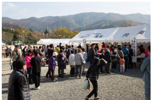
大勢の参加者が集まる「旨いもん広場」の様子。今年は何んなメニューが出るのかは次号のお楽しみ！

〈開催日時〉 11月15日(日) 午前9時～午後3時 〈開催場所〉 上野小学校 〈テーマ〉 「深めよう！沼木の絆」 沼木の親睦を深めるために！ 沼木まつりは、沼木地区内の住民が互いに親睦を深め、住みよいまちづくりを目指し開催しています。 今回のイベントの目玉は、宮川中学校吹奏楽部の皆さんによる演奏です。 平成29年度の沼木中学校・宮川中学校の統合を控え、地域を挙げた交流を目的に宮川中学校吹奏楽部の皆さんにお越しいただき、演奏をしていただく運びとなりました。この機会をとらえ、宮川中学校の皆さんと、より交流を深めていきたいと思えます。また、沼木地域の特色を活かした物産展の開催も企画しています。季節的にも秋の収穫時期となります。この機会に多くの出品をお願いします。 出店については、出店申請書が必要となるため、沼木まちづくり協議会までお申し込みください。 なお、今年の沼木まつりも上野小学校の運動場や体育館で多くのイベントを企画しています。毎年、多くのボラ