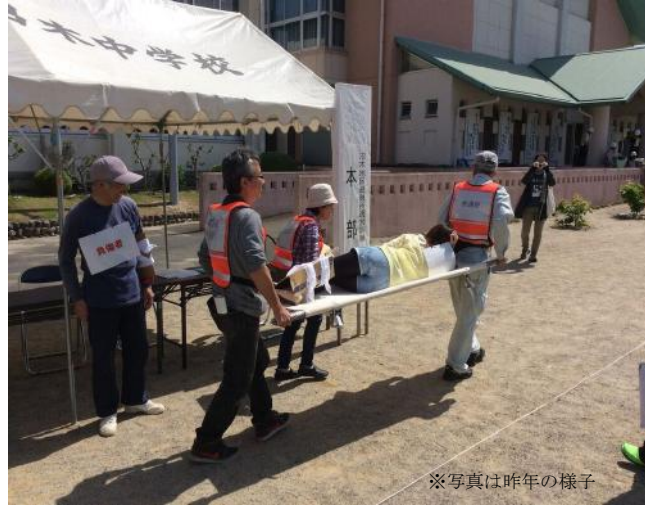
※写真は昨年の様子

5月22日(日)9時から 沼木中学校体育館にて開催! 防災意識を再確認!皆様のご参加をお待ちしております!