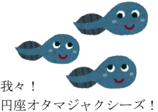
我々! 円座オタマジャクシーズ!

緑が生い茂り春の陽気が感じられる中、円座では田んぼへの水入れも始まり田植え準備が着々と進んでおります。ふるさと便がお手元に届く頃には、田植えも終わっていることでしょうか。これから卵からかえったおたまじゃくしが、元氣よく田んぼをスイスイとたくさん泳ぐことでしょう。 田んぼ道で親カエルがびよこびよこ跳んでいるのを見ると、しみじみ春だなあと実感します。