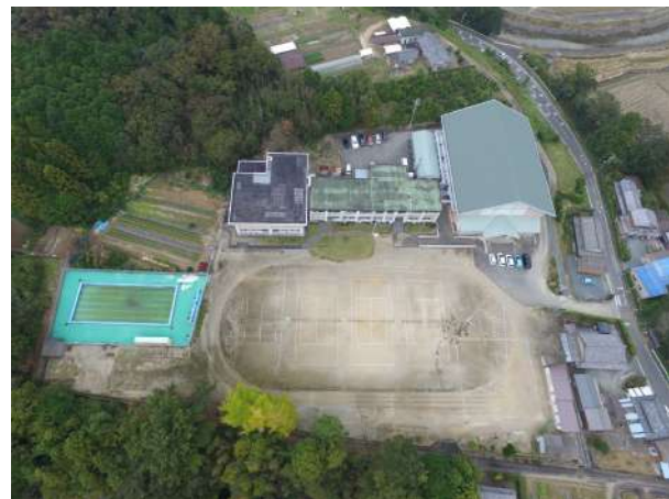
【私たちの沼木中学校】