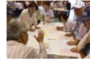
▲沼木地区防災訓練 (2018年5月19日)