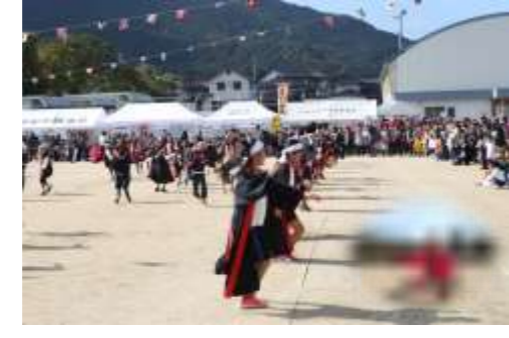
▲沼中ソーランと触発された皆さん