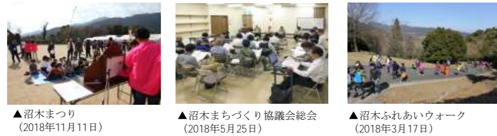
▲沼木まつり (2018年11月11日)