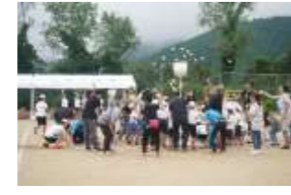
▲上野小学校地域交流運動会 (2018年9月15日)